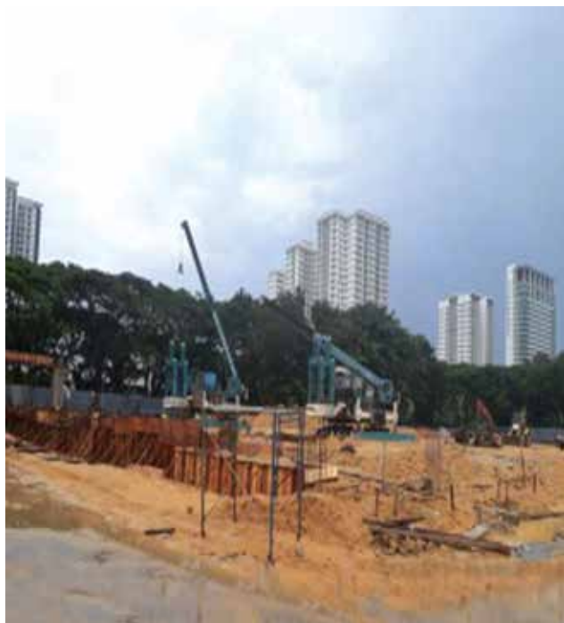
Site Progress At GBS@Mahsuri

The new industrial development area of 'Batu Kawan Industrial Park 2 (BKIP 2) in Byram has been planned for the new Industrial Park. The earth filling works for Phase 1, 106 acres of industrial plots have been planned and is expected to begin in Q2 2020.