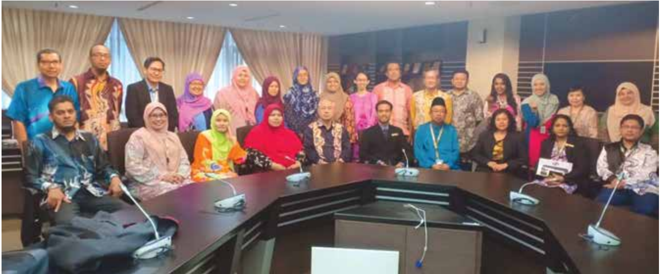
Program Pengurusan Risiko Rasuah (PRR)

Bagi pelaksanaan program-program tersebut di atas, PDC telah merancang untuk melaksanakannya secara berperingkat. Bagi peringkat permulaan, PDC telah berkerjasama dengan pihak Malaysia Anti-Corruption Academy (MACA) dan Suruhanjaya Rasuah Malaysia (SPRM) bagi melaksanakan Pengurusan Risiko Rasuah. PDC juga turut dibantu oleh Unit Integriti, Pejabat Setiausaha Kerajaan Negeri Pulau Pinang.