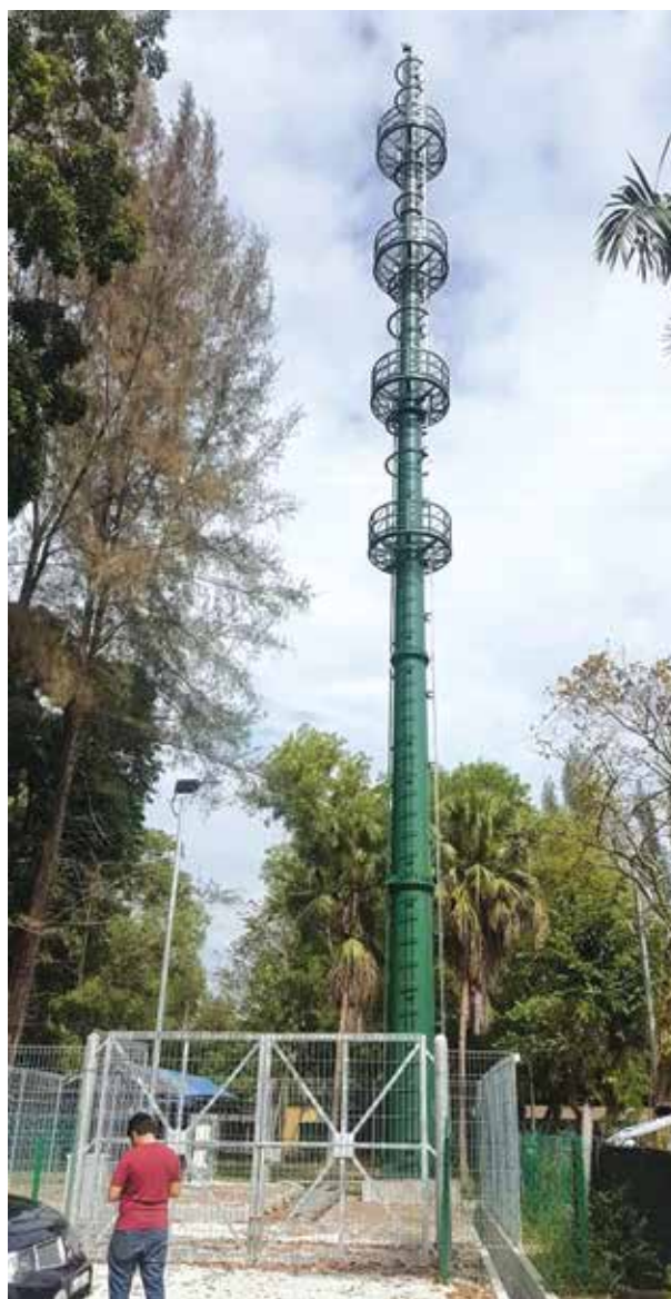
Tapak Villa Tanjung Permai

Pulau Pinang sedang beralih ke Bandar Pintar, 5G dan IR 4.0. Untuk menyokong pelan, PDC Telco merancang untuk membina lebih banyak menara dan menukar lampu jalan biasa kepada Smart Street Light Poles.