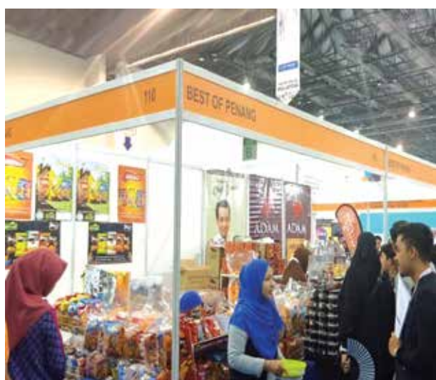
Entrepreneur Booth At Halfest 2019

Halal Penang continues its initiatives to position Penang in the international halal markets enhancing in bilateral trade and businesses through official trade visits and participations in domestic and international trade fairs i.e. at the Malaysian International Halal Showcase (MIHAS) in Kuala Lumpur, Medan Fair, Halal Indonesia Expo Jakarta, Halfest Selangor, Malaysia Fest, Sarajevo Halal Fair Bosnia Herzegovina, Selangor International Business Summit, Perak International Halal Expo, Halal Expo Istanbul Turkey as well as Penang State delegation visits to Dubai, London and Taiwan.