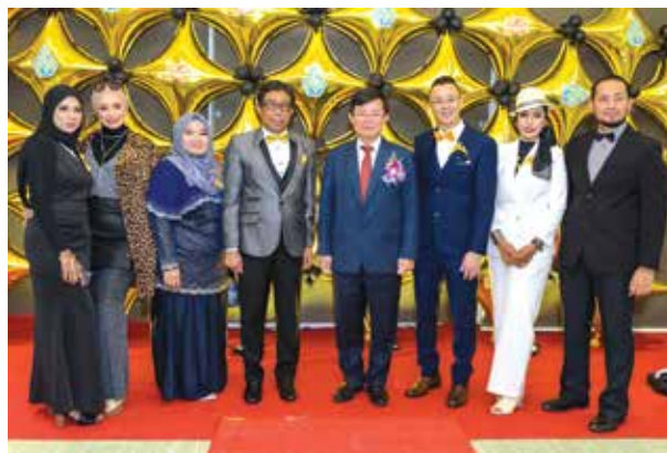
Majlis Makan Malam PDC