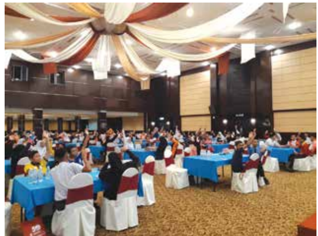
Entrepreneur Simulation Competition

PDC continues with the Program Tunas Niaga (PROTUNE) programmes, a secondary school entrepreneurship management programme to foster and instil the entrepreneurial culture among students. PROTUNE is a cultural programme coordinated by the PDC in collaboration with the Penang State Education Department. In 2019, PROTUNE was implemented using the allocation given by the Ministry of Finance Malaysia in 2016. Despite the budget constraints PDC successfully launched a programme called Entrepreneurial Simulation Competition involving 144 students from 36 secondary schools across the Penang State. This programme educates students to use a module called "Millionaire Entrepreneur" training module to guide the way to do business.