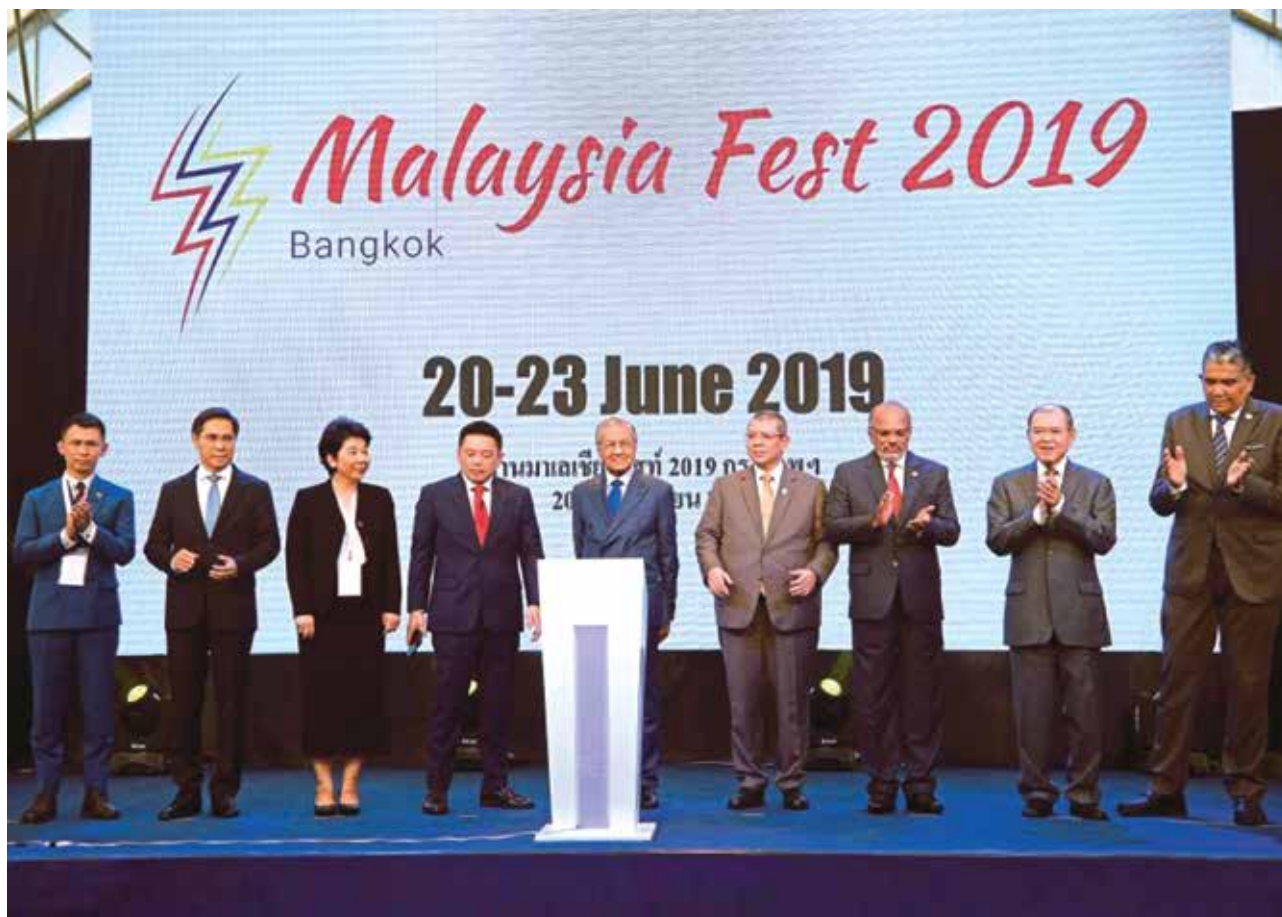
Perasmian Program Malaysia Fest 2019 Bangkok Oleh Tun Dr Mahathir Mohamad, Perdana Menteri Malaysia Ke-7

Bagi program ini, lima 5 usahawan Pulau Pinang telah mengambil bahagian iaitu :