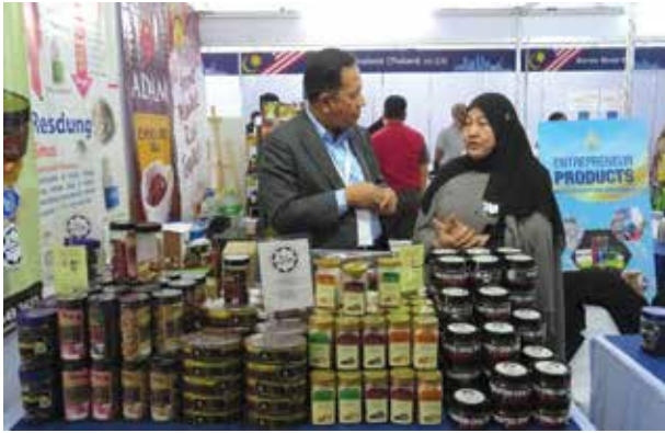
Malaysia Fest 2019, Bangkok

PDC participated in the 9th Muslim World Biz 2019 which was held in the Kuala Lumpur Convention Centre (KLCC) from 4 to 6 September 2019.