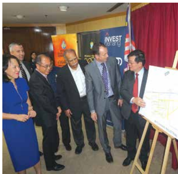
Pengumuman Pelaburan Smith & Nephew Operations Sdn. Bhd.