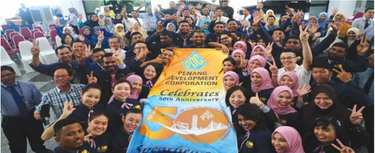
PDC 50th Anniversary Launching Ceremony

The implementation of these events / programmes not only further strengthened teamwork among staff, it also heightened their creativity. Thus, bringing about a positive impact to PDC as follows :-