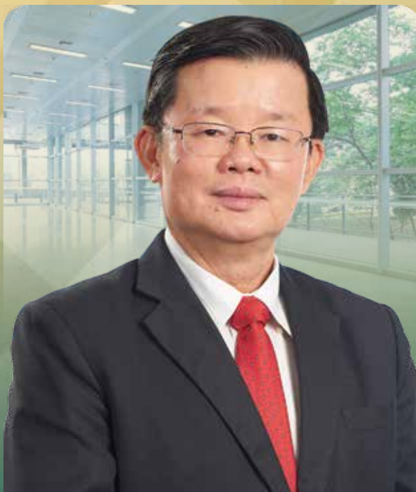
YAB Tuan Chow Kon Yeow Pengerusi / Chairman