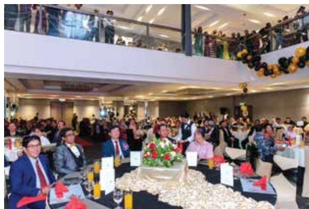
PDC Staff Dinner