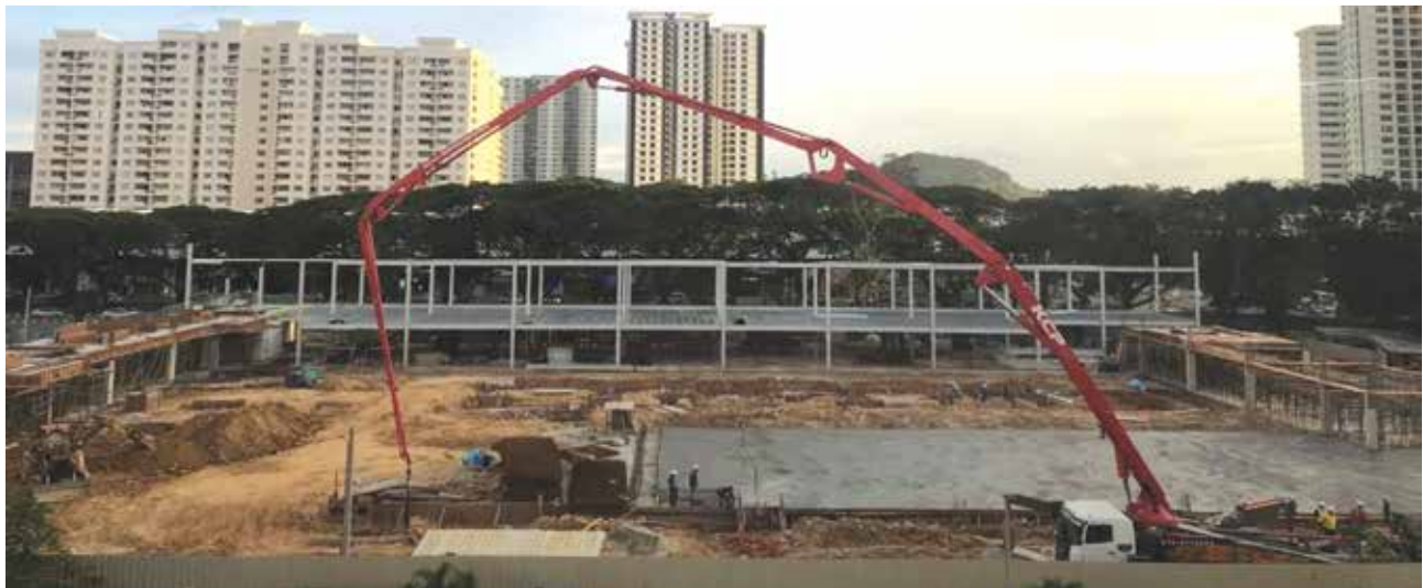
Peringkat Pembinaan Bangunan Pejabat 2-tingkat Di Atas Plot B Tanah Kerajaan (Bersebelahan Lot 9562), Persiaran Mahsuri, Bandar Bayan Baru