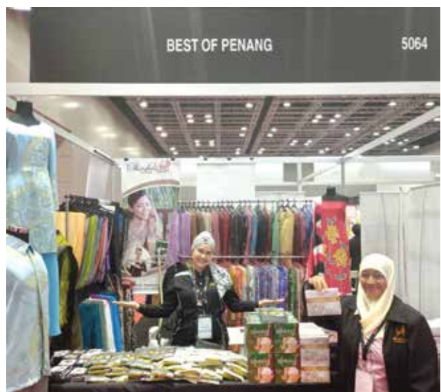
Antara Usahawan Yang Menyertai Program 19th Muslim World Biz 2019