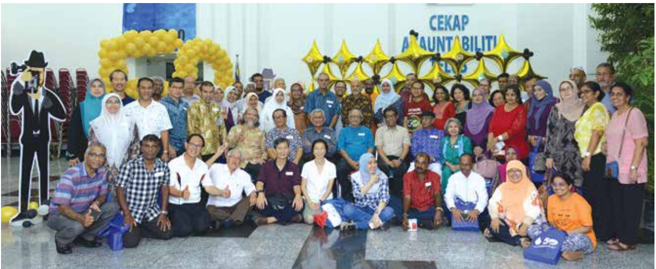
PDC Reunion Dinner

PDC continues to plan and implement projects during the year under review with the aim to meet its stakeholders needs and for the Penang's sustainable development.