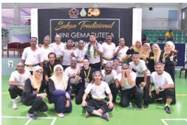
Sukan Tradisional Mini Gemaputera