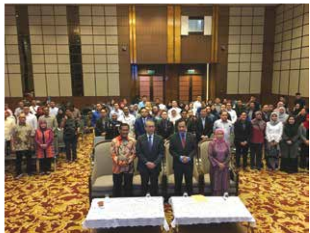
Business Matching Between Penang Entrepreneurs & Indonesian Entrepreneurs

The objectives of this programme were to create a good relationship and to establish a trade networking business among Penang Entrepreneurs with the Entrepreneurs from West Sumatera, North Sumatera and Aceh, Indonesia.