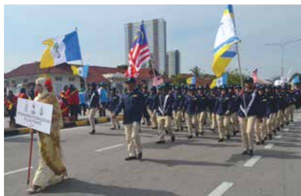
Perarakan sempena Hari Kemerdekaan ke-62