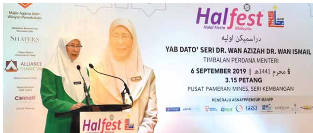
Program Halal Fiesta Malaysia 2019

Halal Penang turut menjalinkan kerjasama dengan Dubai Airport Freezone Authority (DAFZA) melalui misi perdagangan Kerajaan Negeri Pulau Pinang ke Dubai. Beberapa kerjasama dirangka antaranya Program Pilot bersama. Ia adalah acara padanan perniagaan di antara PIHH & HTMC (Halal Trade & Marketing Centre) / DAFZA di Dubai. Pada dasarnya ia adalah program untuk memadankan pembeli / pengimport dari rantau Timur Tengah dan Afrika Utara (MENA) dengan pengeluar produk dan perkhidmatan Halal dari Malaysia. Program pepadanan perniagaan dan pelaburan ini merupakan sebahagian daripada persediaan bagi penyertaan syarikat pengeluar produk dan perkhidmatan halal di Pulau Pinang dan Malaysia dalam acara Expo Dubai 2020 pada bulan November.