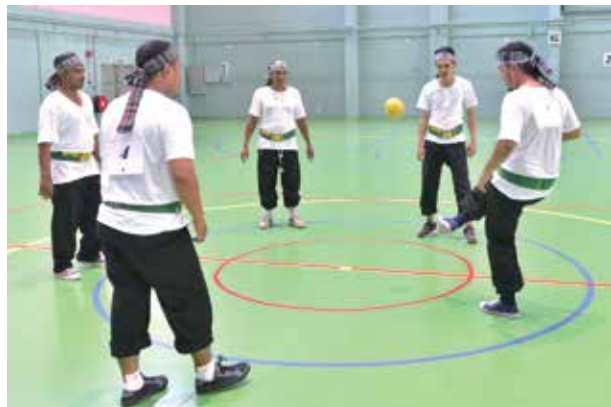
Mini Gemaputera Traditional Games