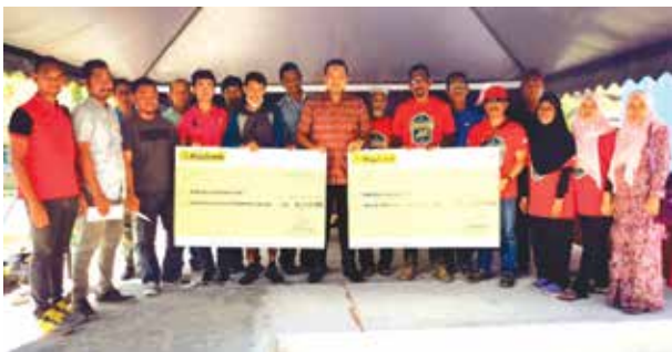
Cheque Handing Over For TUTM Programme

The State Government has allocated RM750,000 to implement this programme. RM863,000 has been disbursed to 156 borrowers since 2015. Loan repayments collected was used to disburse to TUTM loan applicants.