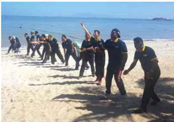
PDC Team Building

Team Building Programmes were also organised by PDC in the 4th quarter of 2019 to enhance the relationship and cooperation among the staff as well as to prepare its team for challenges ahead and to elevate PDC towards excellence.