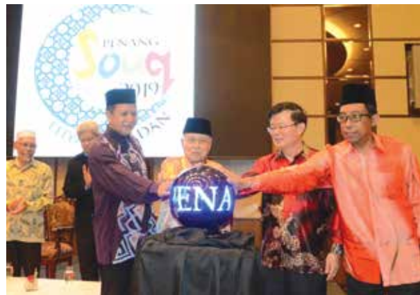
Perasmian Program Penang Souq Ramadan 2019

Program ini merupakan satu konsep penjenamaan di mana semua program dan aktiviti yang dilaksanakan sempena bulan Ramadan dikendalikan oleh pihak peniaga, pengusaha dan pedagang Pulau Pinang dengan menggunakan logo dan tema yang sama.