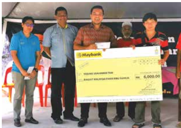
Penyerahan Cek Kepada Para Peminjam TUTM

Kerajaan Negeri telah memperuntukkan dana sebanyak RM750,000 kepada PDC untuk pelaksanaan TUTM dan sebanyak RM863,000 telahpun dikeluarkan kepada 156 peminjam. Kutipan bayaran balik dana telah digunapakai bagi menampung lebih peruntukan dana yang telah diberikan kepada peminjam TUTM.