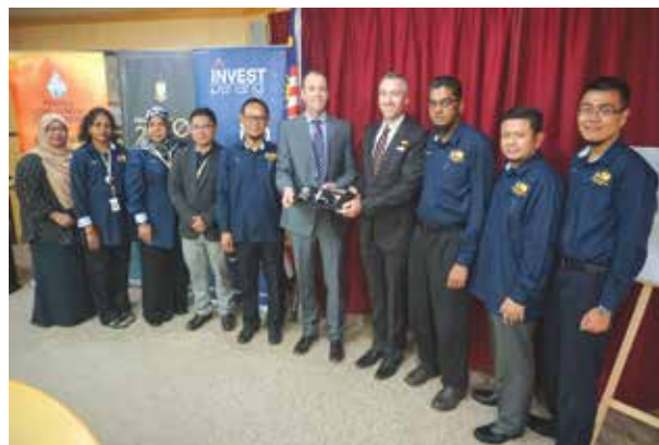
Investment Announcement Of Smith & Nephew Operations Sdn. Bhd.