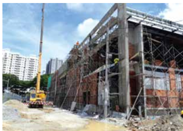
Kemajuan Kerja Di Tapak GBS@Mahsuri

Kawasan pembangunan perindustrian yang baru iaitu 'Batu Kawan Industrial Park 2' (BKIP 2) di Byram telah dirancang untuk Taman Perindustrian yang baru. Kerja menambun tanah bagi menyediakan tapak perindustrian Fasa 1 seluas 106 ekar bagi plot-plot industri telah dirancang dan dijangka akan dimulakan pada suku kedua tahun 2020.