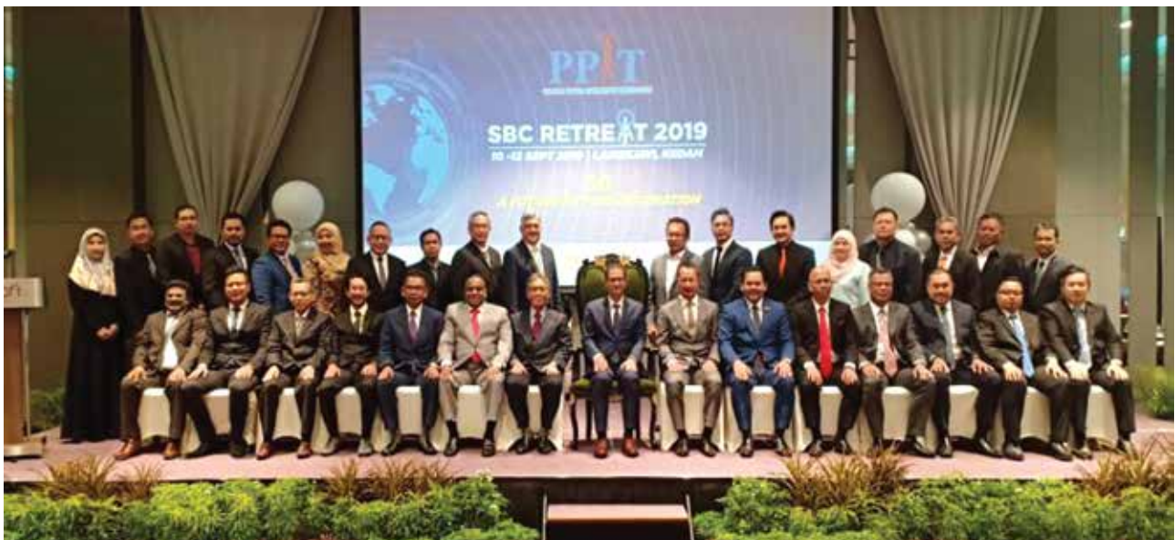
Persatuan Penyedia Infrastruktur Telekomunikasi (PPIT) Retreat 2019

On 8th July 2019, PDC Telco with YB Zairil visited Smart Nation in Singapore which is under the Prime Minister Office to learn how the Smart Nation was implemented so that we can apply this for Digital Penang.