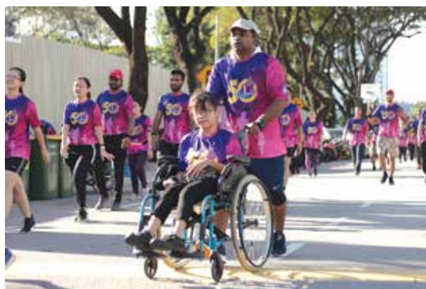
PDC Fun Walk 2019