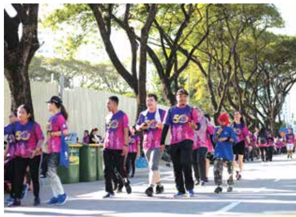
PDC Fun Walk 2019