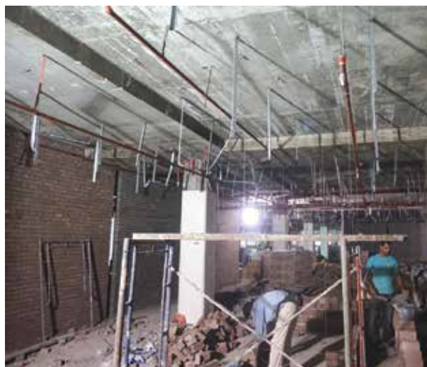
Site Progress At UTC Komtar

The latest project being implemented currently is the establishment of the "Urban Transformation Center" (UTC), KOMTAR, Penang. It is a project jointly undertaken by the State Government (through PDC) and the Federal Government through the Ministry of Finance (MOF) to establish a one-stop centre comprising various government departments which provide various services to the public. It is currently under construction and expected to be fully operational by mid of 2020.