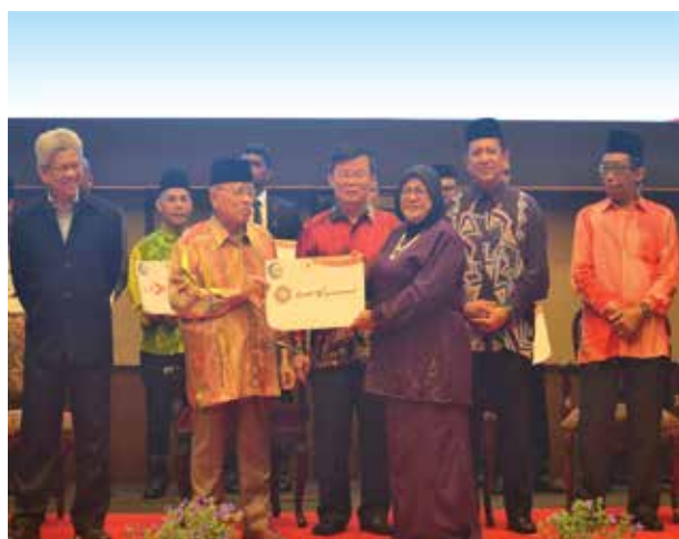
Penang Souq Ramadan