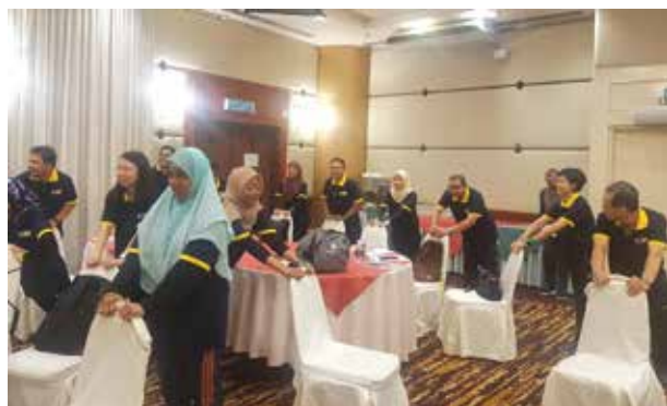
Program 'Team Building' PDC

Program Team Building juga telah dilaksanakan oleh PDC pada suku keempat tahun 2019 untuk merapatkan hubungan dan kerjasama sesama kakitangan supaya kakitangan bersedia membantu PDC menghadapi arus perubahan dan membawa PDC ke tahap yang lebih cemerlang.