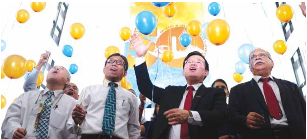
Majlis Pelancaran Program-Program Sempena Ulangtahun PDC Yang Ke-50