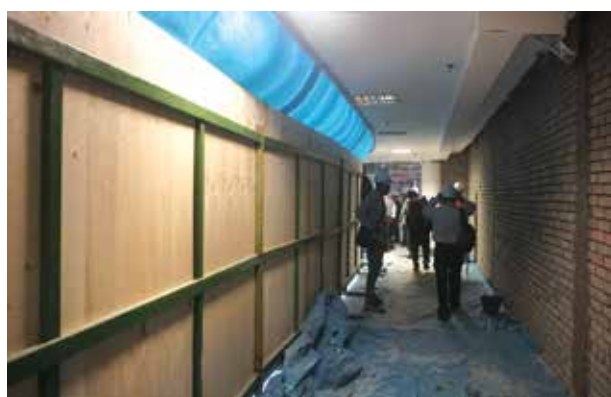
Kerja-kerja Pembinaan UTC KOMTAR

Projek terbaru yang dilaksanakan adalah penubuhan "Urban Transformation Centre" (UTC), KOMTAR, Pulau Pinang. Ia merupakan projek usahasama antara Kerajaan Negeri (melalui PDC) dan Kerajaan Pusat melalui Kementerian Kewangan (MOF) untuk mewujudkan pusat sehenti yang terdiri daripada pelbagai jabatan kerajaan untuk memberi pelbagai perkhidmatan kepada orang ramai. Ianya kini sedang dalam pembinaan dan dijangka akan beroperasi pada pertengahan Tahun 2020.