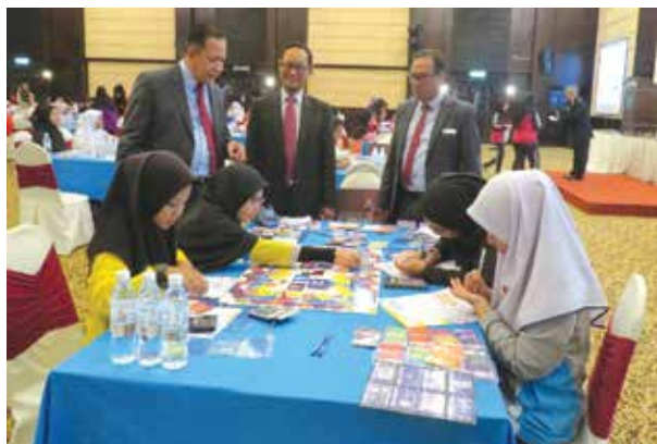
Pertandingan Simulasi Keusahawanan Sekolah Menengah PROTUNE 2019

Program ini telah melatih para pelajar menggunakan modul latihan Millionaire Entrepreneur kerana kaedah ini menyediakan banyak pengetahuan keusahawanan secara mudah, cepat dan menyeronokkan. Pada akhir program, pelajar telah dapat memahami undang-undang serta peraturan dan bagaimana cara menjalani perniagaan secara efektif dan menjana keuntungan.