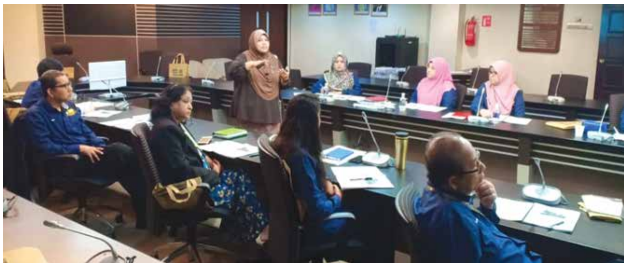
Corruption Risk Management Programme (CRM)

For the implementation of the above programmes, PDC has been planning to implement it in stages. For the initial stage, PDC has collaborated with the Malaysian Anti-Corruption Academy (MACA) and Malaysian Corruption Commission (MACC) to implement the Corruption Risk Management. PDC was also assisted by the Integrity Unit, State Secretary Office Penang.