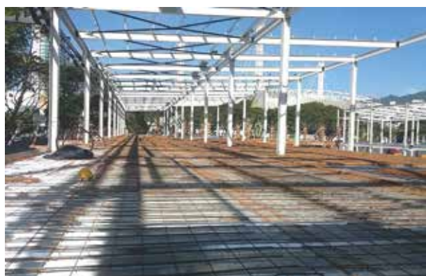
Site Progress For 2-storey Office Building On Plot B Tanah Kerajaan (Bersebelahan Lot 9562) Persiaran Mahsuri, Bandar Bayan Baru

Nusabina will continue to grow and improve its performance in order to increase customer confidence in the future.