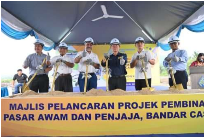
Ketua Menteri dan barisan kepimpinan Kerajaan Negeri menyempurnakan gimik pelancaran pembinaan pasar awam dan penjaja pertama di Bandar Cassia di sini sebentar tadi.

“Pembinaan projek ini dibahagikan kepada dua fasa yang mana fasa pertama melibatkan kerja dan rawatan tanah manakala fasa kedua pula merangkumi pembinaan bangunan dan infrastruktur,” katanya semasa berucap pada majlis pelancaran projek berkaitan di sini sebentar tadi.