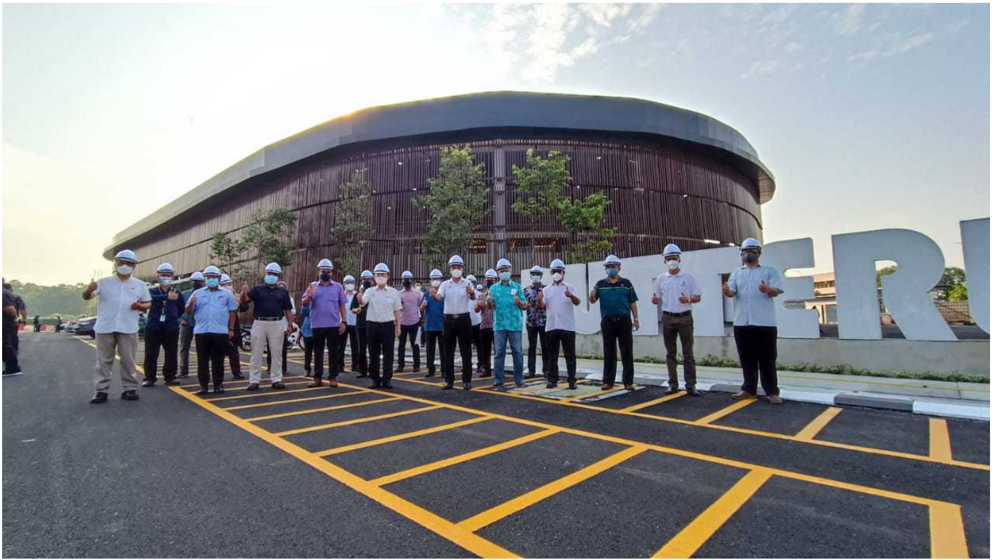
ANTARA pemimpin Kerajaan Negeri yang menyertai lawatan tapak projek Arena Butterworth bersama-sama Ketua Menteri di sini pada pagi tadi.